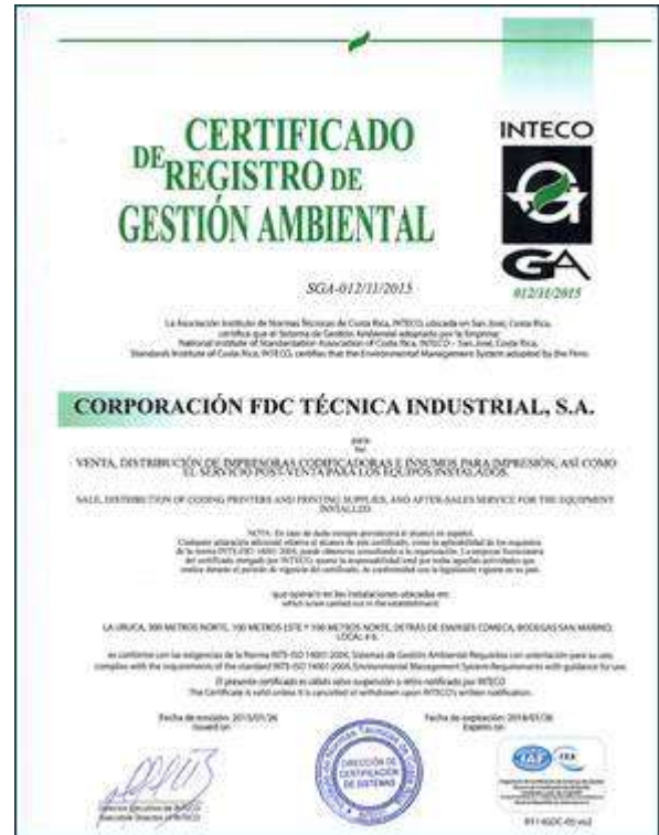
Los certificados iso 9000 e iso 14.000: Certificados bajo las normas ISO 9000 e ISO 14000 obtenidos con el apoyo del Fondo Propyme.

Los ejecutivos de FDC recomiendan a las diferentes Pymes nacionales el uso de los fondos PROPYME debido al gran impulso que dieron a su empresa para poder lograr la certificación y en general, para mejorar sus procesos y servicios.