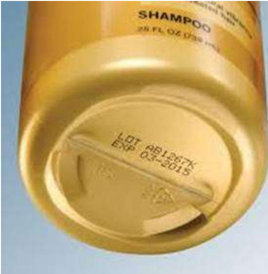
Impresión de fondo en una botella de shampoo.

Tanto la encargada del Sistema de Gestión de la Calidad como el encargado de control de los inventarios reconocen que si no hubiese sido por los fondos Propyme, no hubiera sido posible la certificación ya que este es un proceso relativamente costoso y gracias a la ayuda del Estado Costarricense, solamente tuvieron que aportar una contrapartida de un veinte por ciento de costos del proyecto la cual en buena parte fue a través de horas de los mismos colaboradores de FDC y lo demás fue inversiones o gastos que si requirieron de egresos de efectivo.