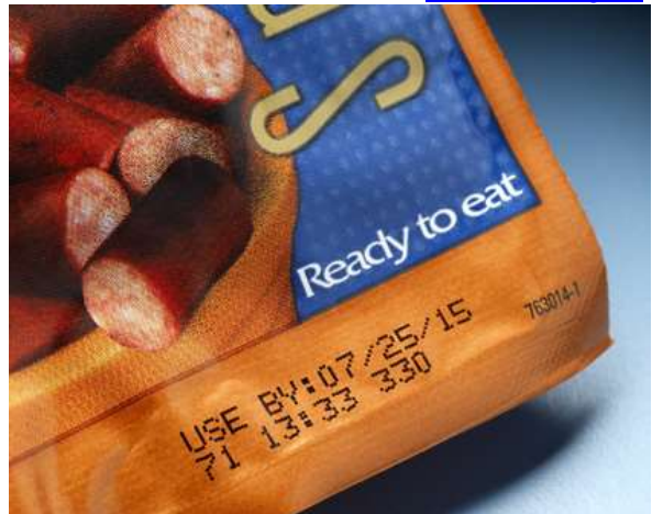
Impresión en un empaque de salchichas.

¿Ha tenido usted la curiosidad de revisar en alguna botella de vidrio o lata los códigos y fechas de producción o vencimiento que traen marcados? ¿Sabía que la mayoría de esos códigos de barras, números y fechas permiten la trazabilidad de diferentes productos y contar de esta manera con toda la información disponible sobre la historia de un alimento? Así, si un producto determinado o un lote específico tiene que ser retirado por una razón de mercado, la marca es un elemento clave para poder ubicarlo y retirarlo.