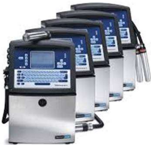
Equipo para codificación y marcaje.

Por otra parte don Javier Aragón, ejecutivo del área de ventas, indica que la empresa maneja diferentes tecnologías, por ejemplo, la transferencia térmica, que produce una impresión de alta calidad y definición, que se utiliza normalmente en laminados plásticos. También utilizan tecnología de inyección de tinta que se utiliza típicamente en líneas de producción de muy alta velocidad y calidad de impresión; también se utiliza la tecnología láser para aplicaciones especiales esta tiene la ventaja de no utilizar consumibles por ende no genera desechos, por lo que es una tecnología muy versátil y con un bajo costo operativo.